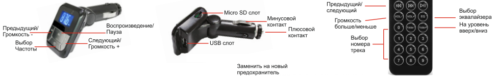
Схема замены предохранителя